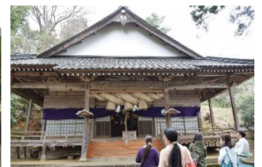
龍の彫り物がすごい