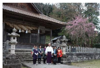
豪華ご祭神に興味津々