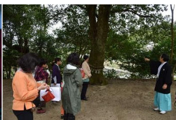
ご神木に蔓蛇さんが...