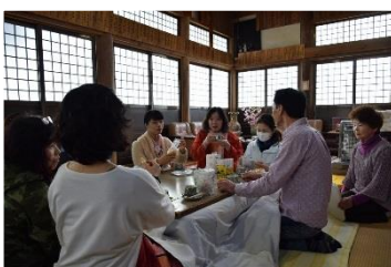
ほのぼの、こたつであられ