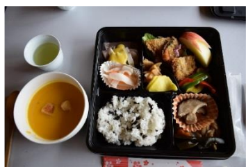
こんにゃくまで手作り