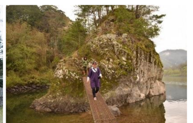
ドキドキ渡りました