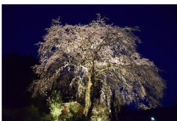
夜の前川桜に大歓声

<コース>4/2(土)・沢谷の各所・千原八幡宮・亀遊亭・浄土寺・河原と対岸で三江線撮影・千原八幡宮夜桜神楽 4/3(日)・松尾山八幡宮・田立建理根命神社・西光寺・比之宮T様宅でランチ・天津神社・明神岩 お世話になった皆さまありがとうございました!! これからも色々なプランを作っていきたいです。