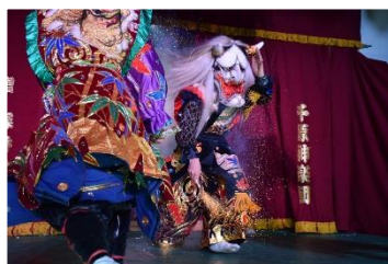
最初から最後まで全員釘付け